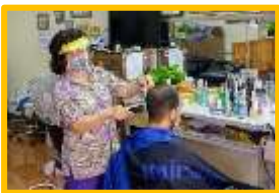
ร้านเสริมสวย